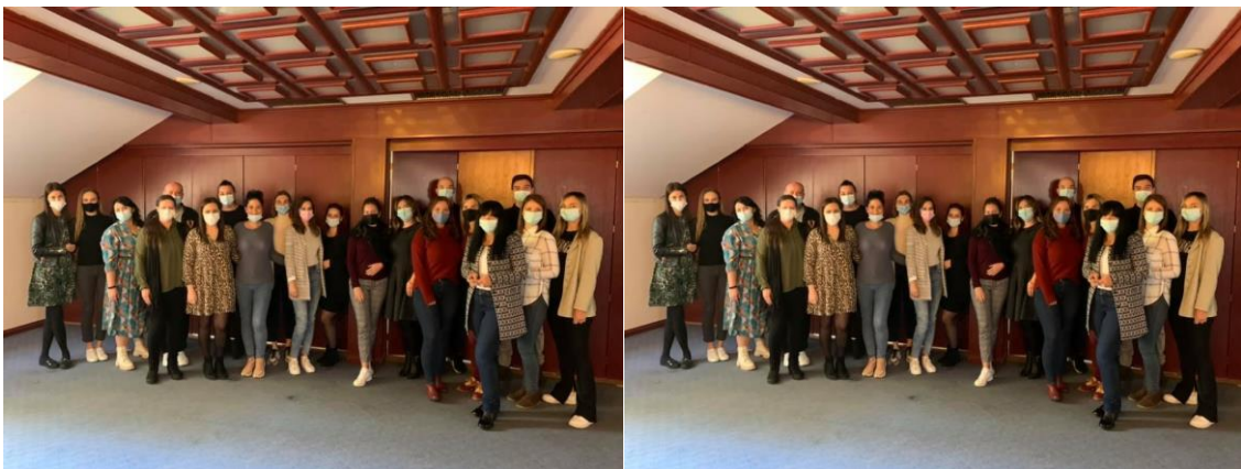
Обуке „Сигурним кораком до хранитељства 2“