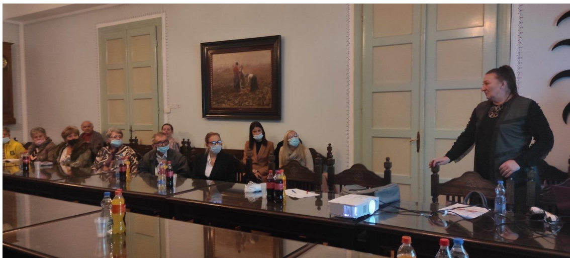
Обуке хранитеља ургентно и специјализовано хранитељство